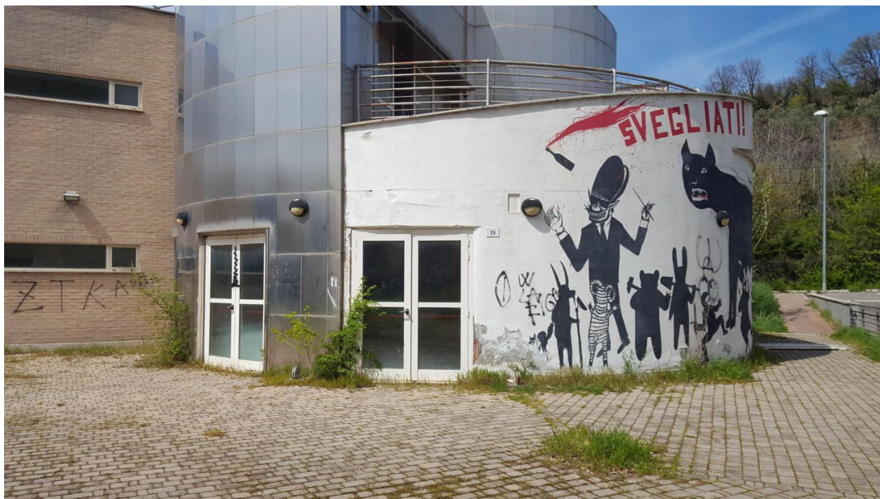
Ingresso principale Casa delle Musiche