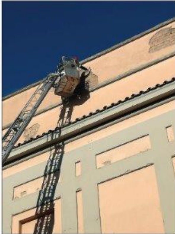
Foto n.1 Intervento VVF per la messa in sicurezza della facciata posteriore