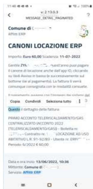
Fig. 3: esempio di messaggio LocazioniERP