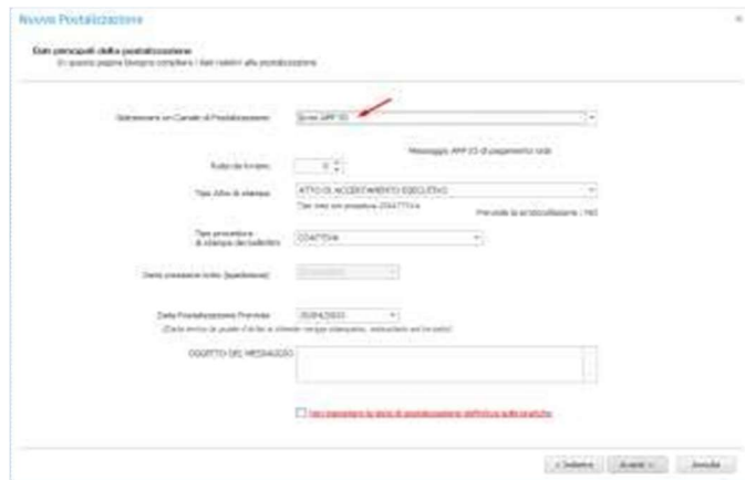
Fig. 4: Invio "solo App IO"