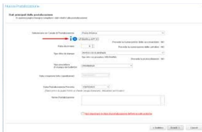
Fig. 5: Invio Tradizionale + App IO automatico