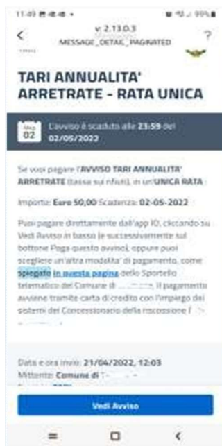
Fig. 2: esempio di messaggio Tari