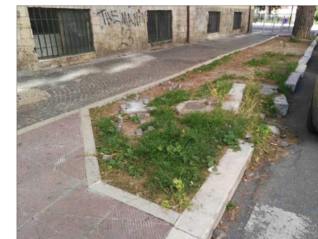
Via N. Sauro, ammaloramenti pavimentazione marciapiede