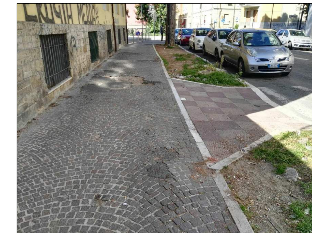
Via N. Sauro, ammaloramenti pavimentazione marciapiede