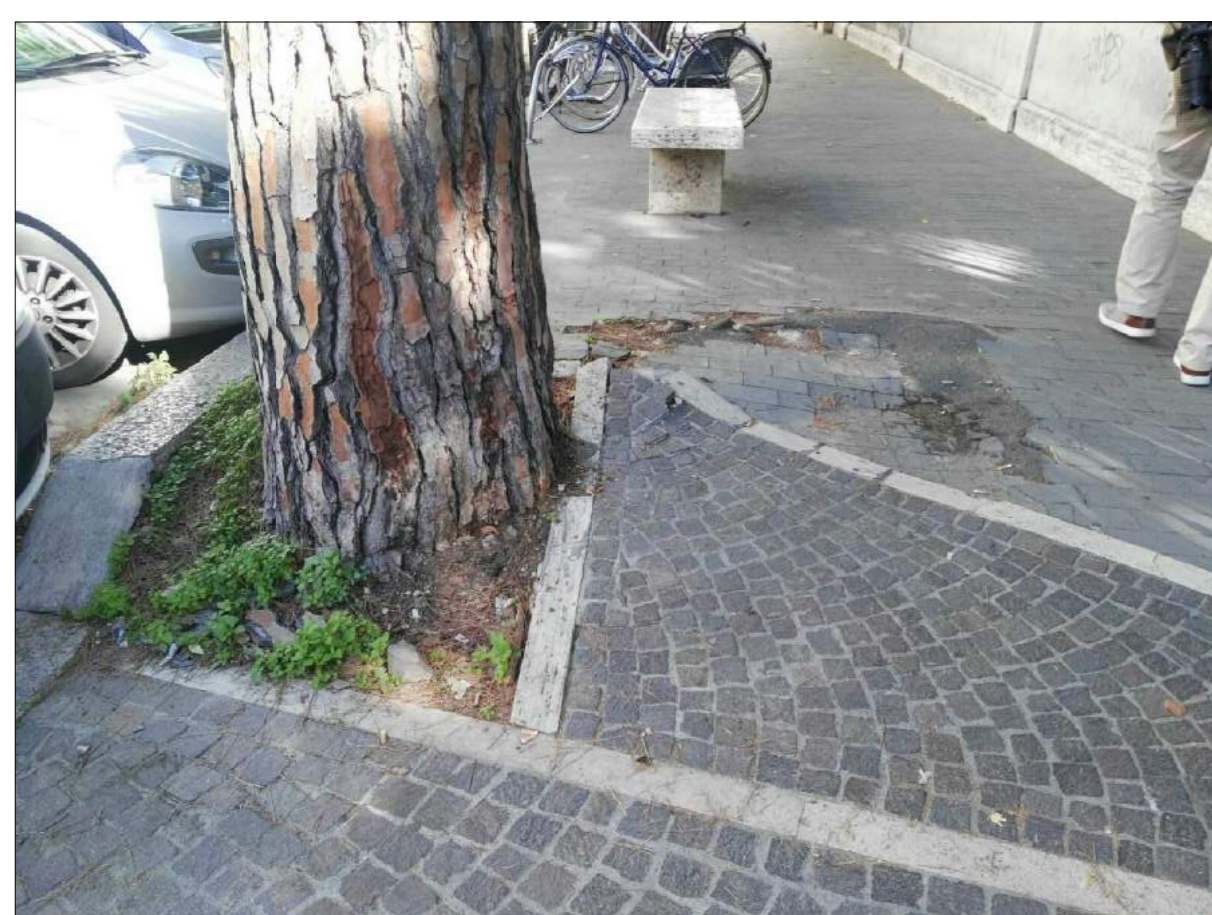
Via 1° Maggio, ammaloramenti pavimentazione marciapiede