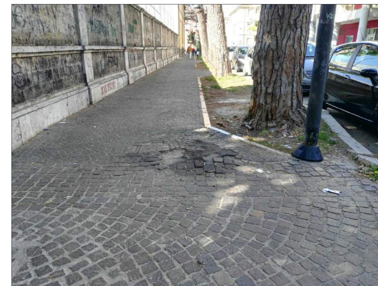
Via N. Sauro, ammaloramenti pavimentazione marciapiede