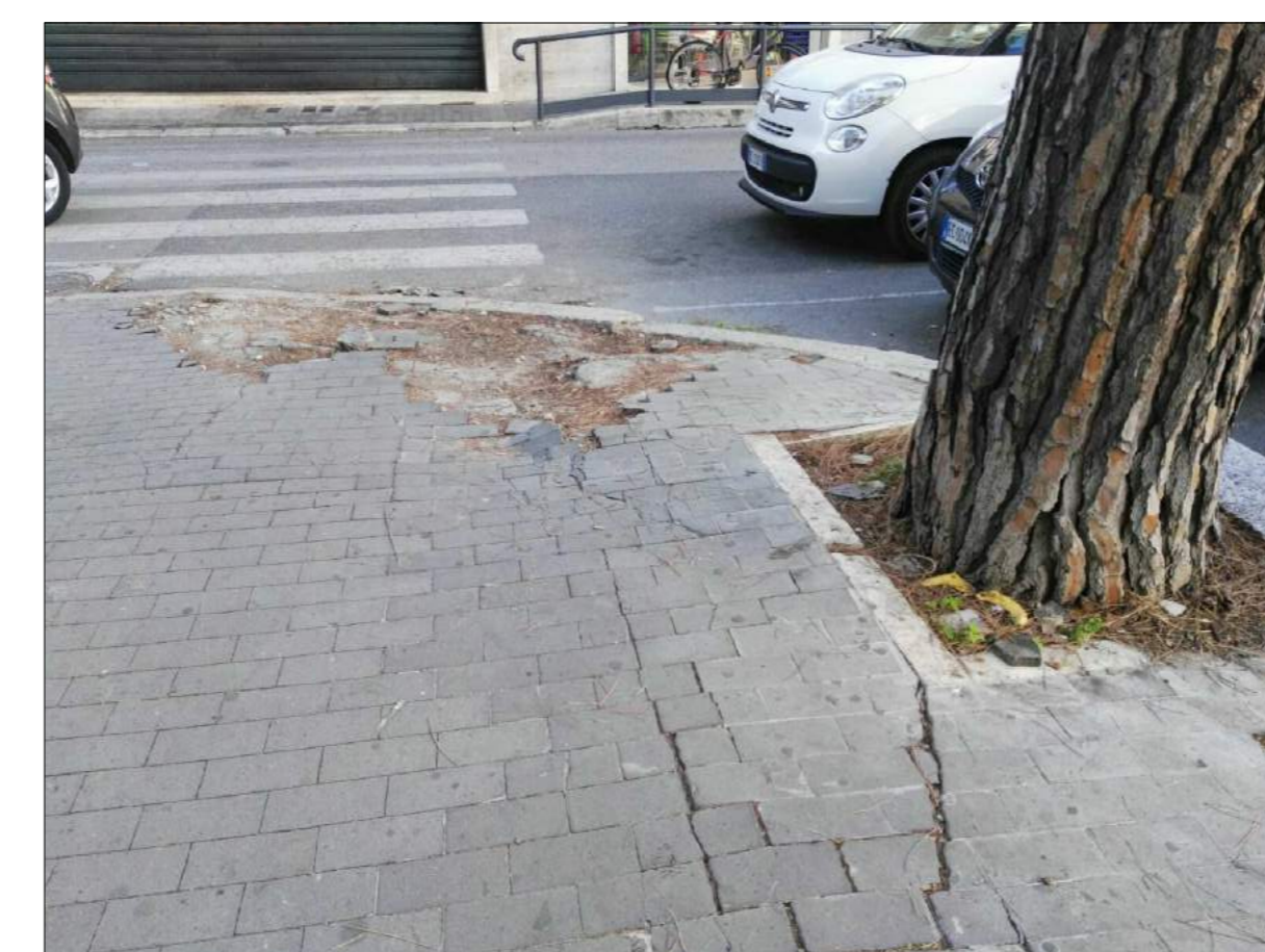
Via 1° Maggio, ammaloramenti pavimentazione marciapiede