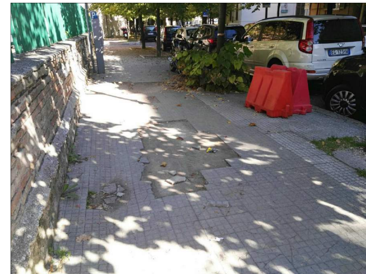
Viale Fratti, ammaloramenti pavimentazione marciapiede