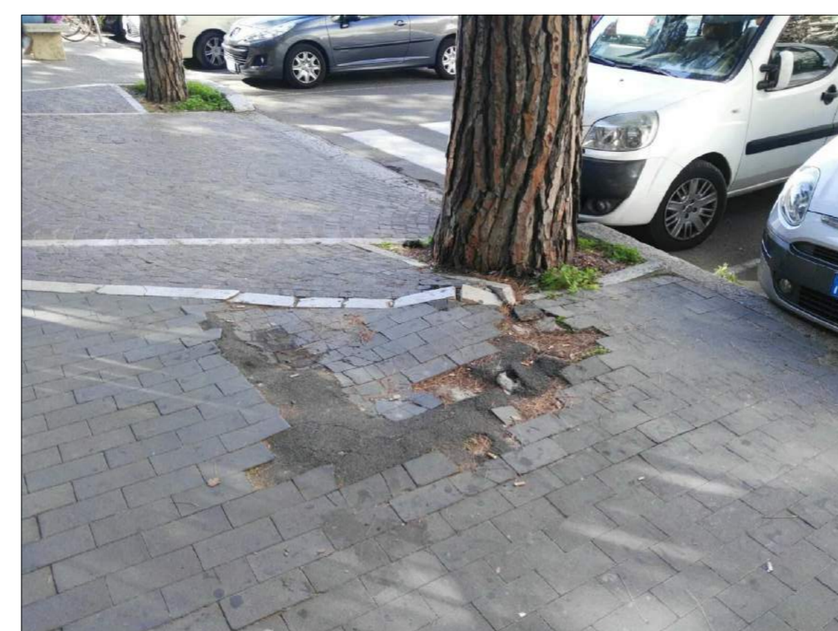
Via 1° Maggio, ammaloramenti pavimentazione marciapiede