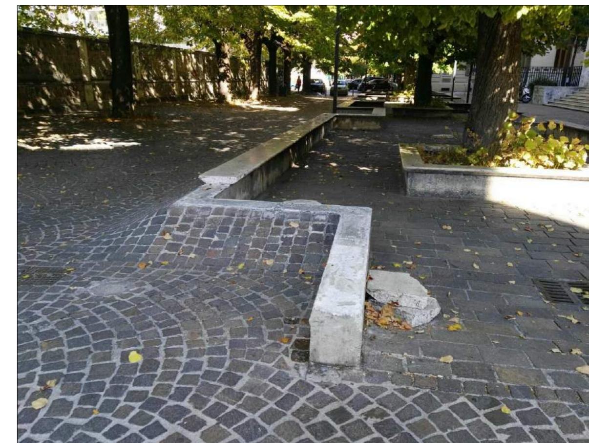
Viale Fratti, ammaloramenti pavimentazione area pedonale