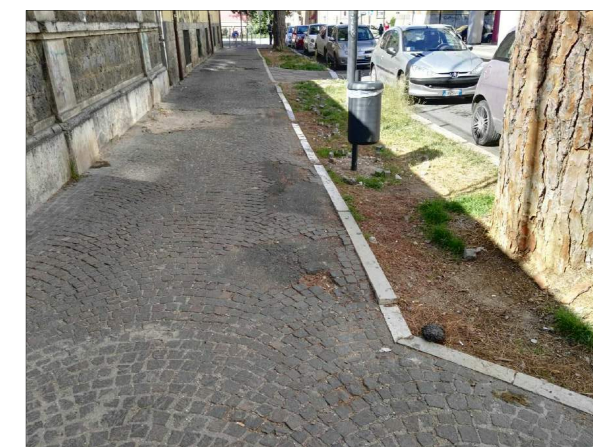
Via N. Sauro, ammaloramenti pavimentazione marciapiede