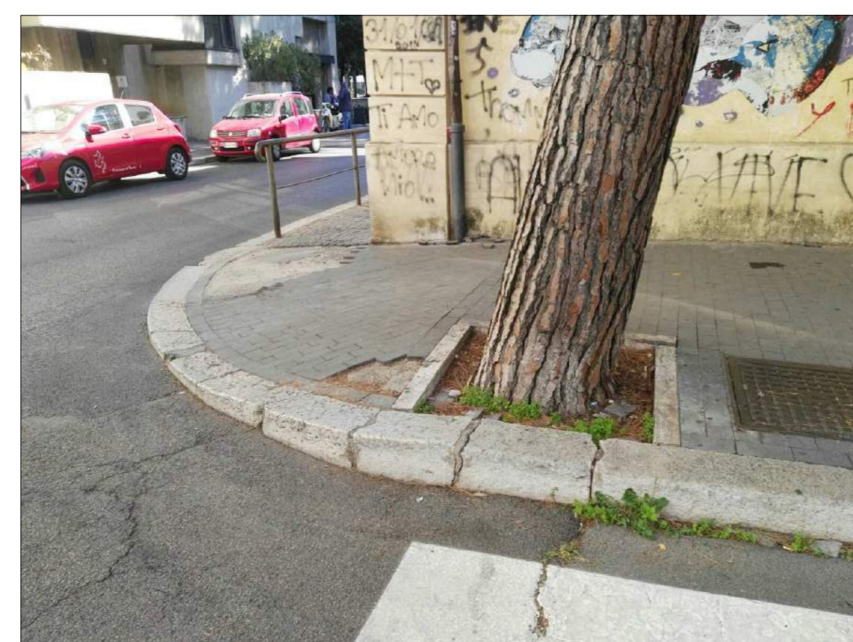
Via 1° Maggio, ammaloramenti pavimentazione marciapiede/piano viabile