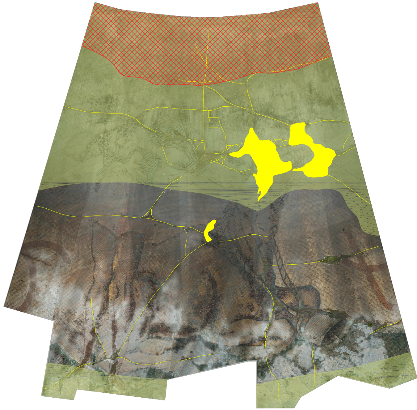
SCALA 1/25 0 0.50 1 m