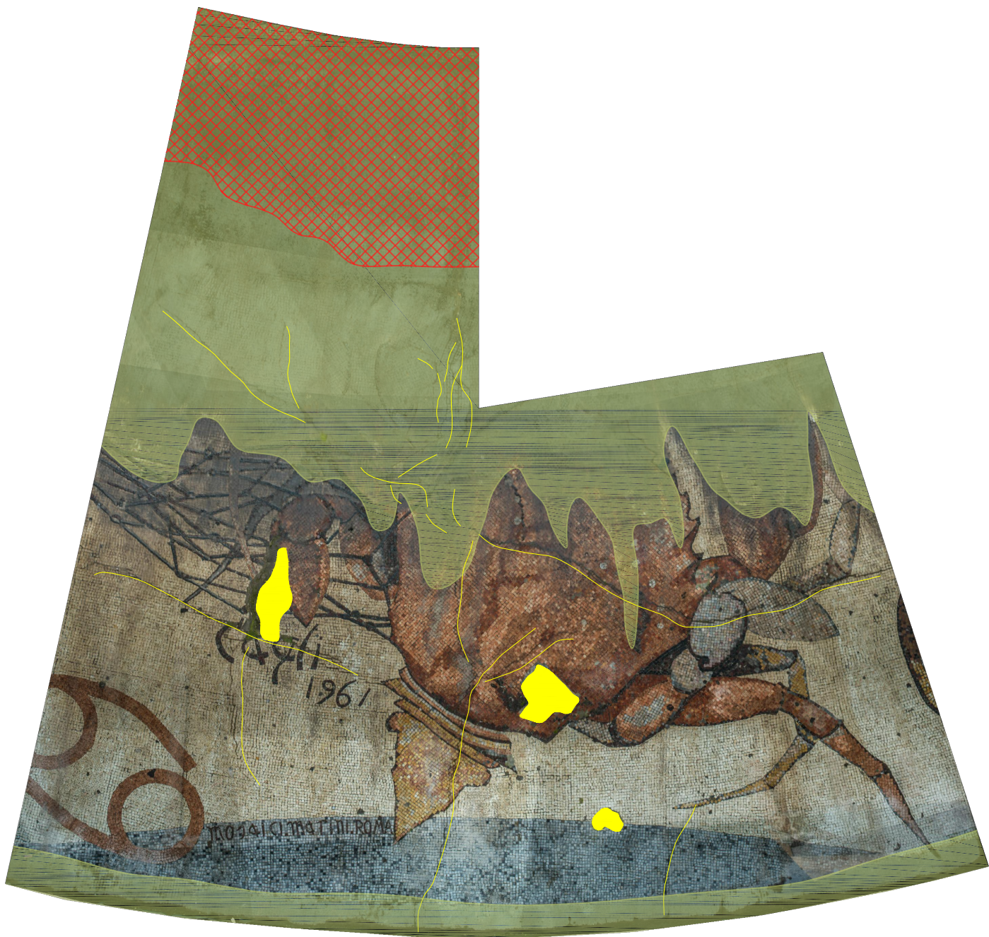
SCALA 1/25 0 0.50 1 m